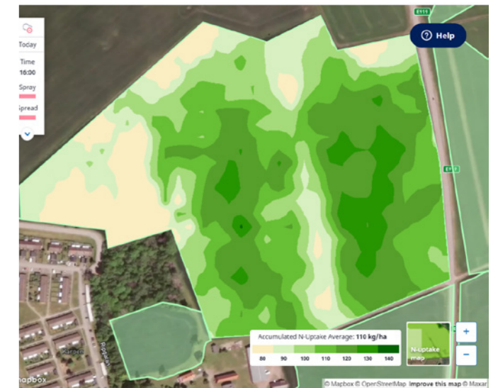
Satellitkarta från Atfarm visar rapsens varierade växtnäringsbehov.

• Krav på förnybara bränslen i lastbilstransporter in och ut från gårdarna I det här projektet har också båttransporten av gödsel till Sverige skett med RME.